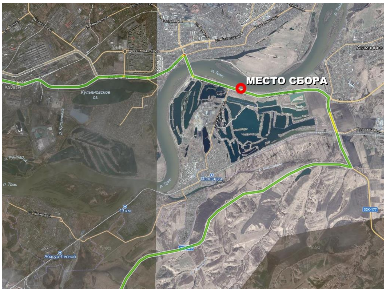
Схема проезда до водоема:

Добираться до места проведения соревнований (53.770146, 87.338304) автомобильным транспортом по схеме.