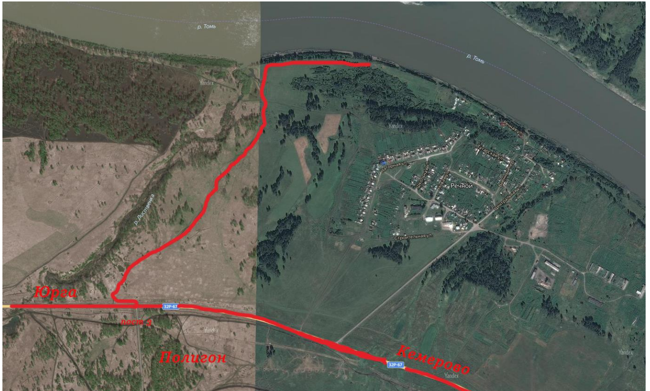
Схема проезда до водоема:

Добираться до места проведения соревнований (55.698271, 85.095166) автомобильным транспортом по трассе 32Р-67 «Кемерово-Юрга» до п. Речной. Далее поворот на грунтовую дорогу напротив КПП №3. Далее 2 км по грунтовой дороге до берега р. Томь. Участники соревнований добираются до места проведения соревнований самостоятельно.