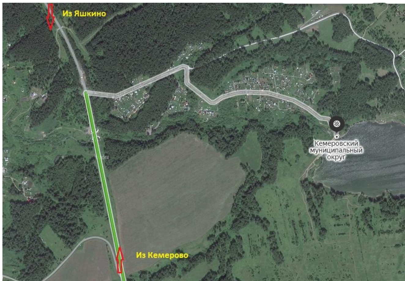
Схема проезда до водоема:

Добираться до места проведения соревнований (55.471127, 86.000803) автомобильным транспортом по трассе 32К-68 до поворота на СНТ «Спектр-2», далее по схеме.