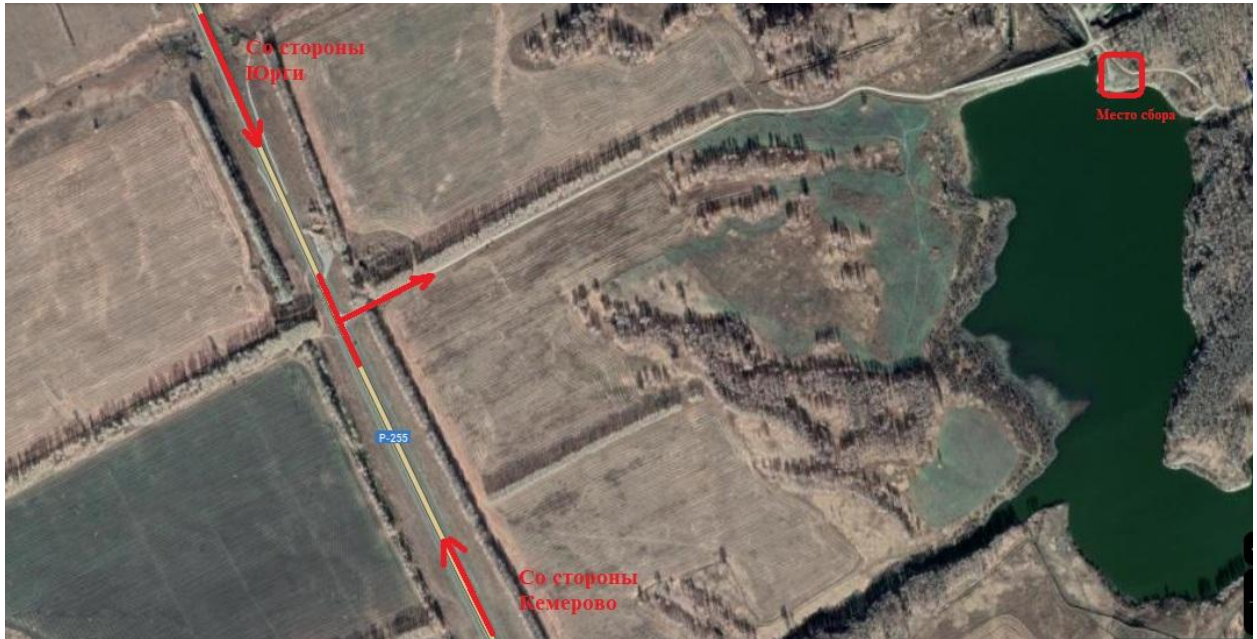
Схема проезда до водоема:

Добираться до места проведения соревнований (55.592268, 84.864958) автомобильным транспортом по автодороге Р-255 «Сибирь» до поворота на дорогу, ведущую к базе отдыха «Пасека». Далее 1,5 км по грунтовой дороге до дамбы. Участники соревнований добираются до места проведения соревнований самостоятельно.